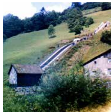
▲ tremplin plastique au Chajoux