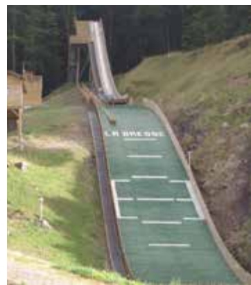
▲ Le K45 de Lispach