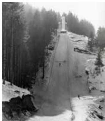
▲ Tremplin d'entre les gouttes

Le tremplin du Pendant-Pré, inauguré en 1967, est une version plastique pour les entraînements annuels et compétitions estivales. Ce K25 était un bon tremplin, mais son emplacement, mal choisi au départ, a eu raison de sa pérennité. L'accès traversait des propriétés privées et son exposition plein sud a très vite jauni le plastique de sa structure. Les derniers sauts ont lieu en 1980 et le tremplin est