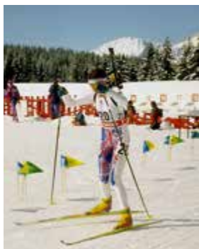
▲ Véronique Claudel aux JO d'Alberville