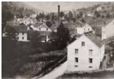
▲ Usine Jeangeorge

L'eau, c'est la vie ! Mais l'eau, c'est aussi l'industrie ... Et si la question n'a pas été évoquée avec l'industrie du bois, il coule de source que l'eau était nécessaire pour les scieries. Mais c'est aussi cette ressource qui justifia l'implantation de tissages dans la vallée.