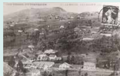
▲ Les Grands Vieux

En 1922, 166 ouvriers travaillent aux Grands Vieux et 38 au Pré Parmentier. Et en 1924, 440 métiers à tisser fonctionnent aux Grands Vieux pour fabriquer essentiellement du calicot. Tandis que l'usine du Pré Parmentier a arrêté le tissage pour se consacrer à la préparation du fil et des bobines.