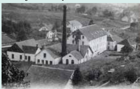
▲ Usine du pont Parmentier avant son agrandissement vers 1890.

En 1832, Jean-Joseph Perrin crée le premier tissage de la vallée du Chajoux, au bord de la goutte du Rouan. C'est une petite entreprise avec ses 22 métiers à tisser des calicots, logée dans un local, qui ressemble davantage à une cité qu'à une usine ! Suite à son développement, l'atelier