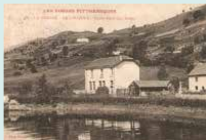
▲ École privée de filles et étang des Zelles vers 1910