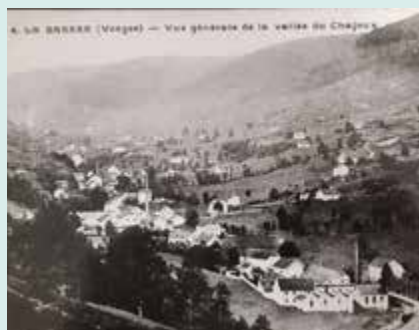
▲ Vue des tissages au Chajoux

Chajoux et rémunère l'institutrice. Elle continue également de construire des cités pour ses ouvriers.